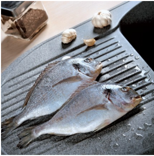
Ellenáll a szagoknak.

A Barcol keménységi teszt alapján termékeink a 70-75 fokok sávba esnek, amely a világ élvonalába helyezi őket.