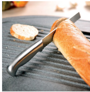
Ellenáll a karcolásnak.

A mosogatók Granitogresből készülnek amit Magranit is hívnak. Ez az anyag akrilgyanta és kvarc vagy gránit keveréke ami nagyon magas keménység elérését teszi lehetővé.