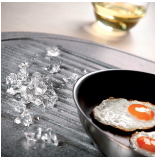
Ellenáll a magas és alacsony hőmérsékleteknek.