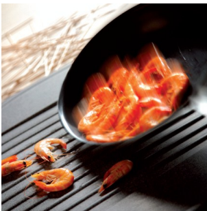
Ellenáll az ütésnek.

A Marmorinnál gyártott mosogatók a széles színválaszték miatt még a legkifinomultabb árnyalatú konyhákba is beilleszthetőek.